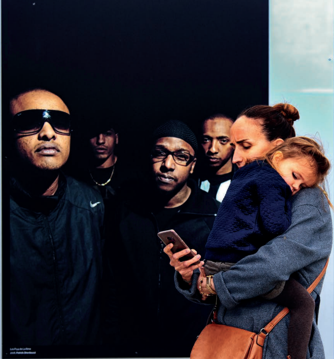
Les Fils de La Haine 2005, Patrick Chamoiseau